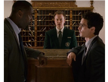
2008 LE BAL DE L'HORREUR (Prom Night) de Nelson McCormick avec James Ransone