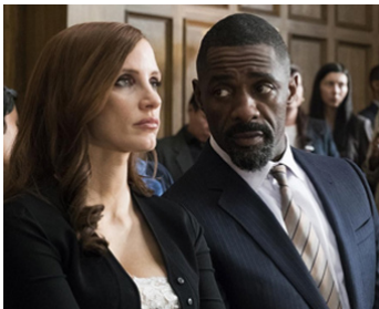
2017 LE GRAND JEU (Molly's Game) d'Aaron Sorkin avec Jessica Chastain