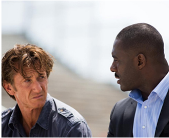
2015 GUNMAN (The Gunman) de Pierre Morel avec Sean Penn