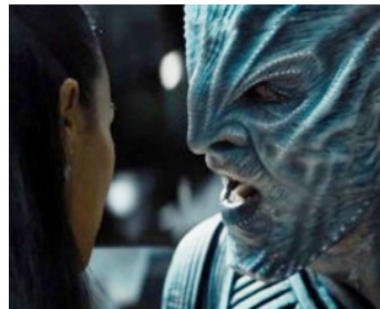
2016 STAR TREK, SANS LIMITES (Star Trek Beyond) de Justin Lin avec Zoe Saldana