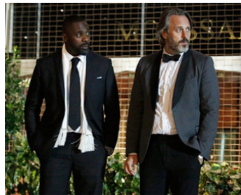
2016 100 STREETS de Jim O'Hanlon avec Ken Stott