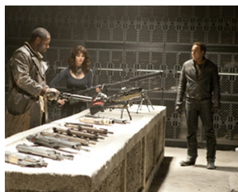
2012 GHOST RIDER 2 (Spirit of Vengeance) de M. Nevelidine & B. Taylor avec V. Placido, N. Cage