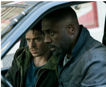
2016 BASTILLE DAY (Bastille Day) de James Watkins avec Richard Madden