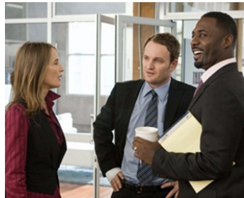
2008 THE HUMAN CONTRACT de Jada Pinkett Smith avec Anne Ramsey, Jason Clarke