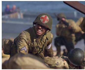
2001 SOLDATS SANS BATAILLE (Buffalo Soldiers) de Gregor Jordan