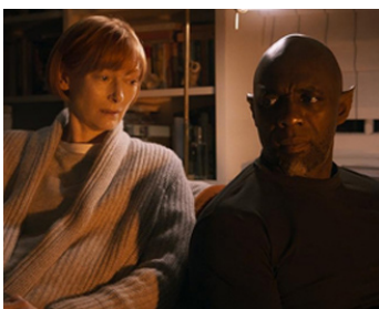
2022 3000 ANS À T'ATTENDRE (3000 Years of Longing) de George Miller avec Tilda Swinton