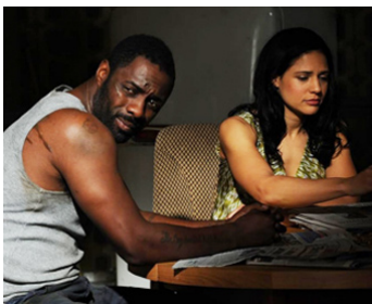
2010 LEGACY (Legacy) de Thomas Emorose Ikimi avec Monique Gabriela Curnen