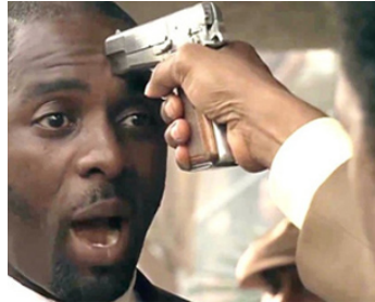
2007 AMERICAN GANGSTER (American Gangster) de Ridley Scott avec Denzel Washington