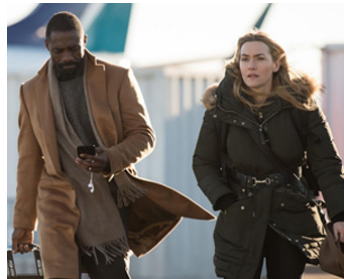
2017 LA MONTAGNE ENTRE NOUS (The Mountain between us) d'Hany Abu-Assad avec K. Winslet