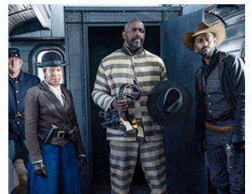
2021 THE HARDER THEY FALL de Jeymes Samuel avec Regina King, LaKeith Stanfield