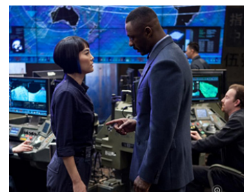
2013 PACIFIC RIM (Pacific Rim) de Guillermo Del Toro avec Rinko Kikuchi