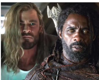
2011 THOR (Thor) de Kenneth Branagh avec Chris Hemsworth