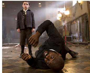
2009 UNBORN (The Unborn) de David S. Goyer avec Ethan Cutkosky