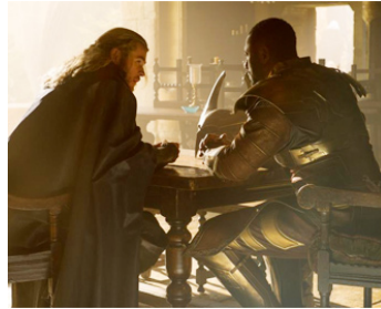
2015 AVENGERS, L'ÈRE D'ULTRON (Avengers, Age of Ultron) de J. Whedon avec Chris Evans