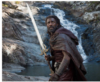
2013 THOR, LE MONDE DES TÉNÉBRES (Thor, the Dark World) d'Alan Taylor