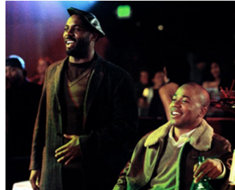
2007 THIS CHRISTMAS de Preston A. Whitmore avec Columbus Short