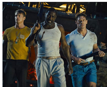
2021 SUICIDE SQUAD (The Suicide Squad) de James Gunn avec John Cena, Joel Kinnaman