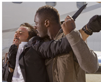
2010 THE LOSERS (The Losers) de Sylvain White avec Jeffrey Dean Morgan