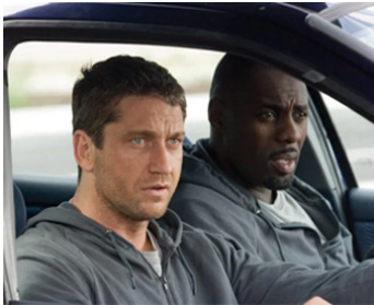
2008 ROCKNROLLA (RocknRolla) de Guy Ritchie avec Gerard Butler