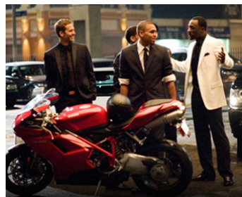
2010 TAKERS (Takers) de John Luessenhop avec Michael Ealy, Paul Walker