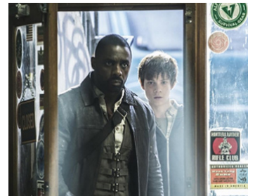
2017 LA TOUR SOMBRE (The Dark Tower) de Nikolaj Arcel avec Tom Taylor