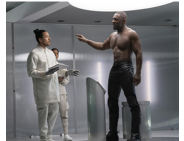
2019 FAST AND FURIOUS, HOBBS & SHAW de David Leitch avec Axel Nu