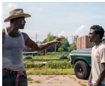
2020 CONCRETE COWBOY de Ricky Staub avec Caleb McLaughlin