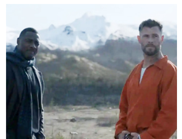
2023 EXTRACTION 2 (Tyler Rake 2) de Sam Hargrave avec Chris Hemsworth