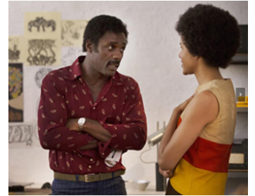
2016 GUÉRILLA (Guerrilla) de John Ridley avec Zawe Ashton