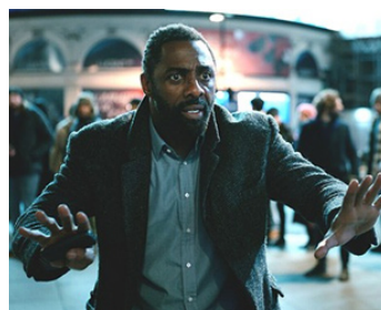
2023 LUTHER, SOLEIL DÉCHU (Luther: the Fallen Sun) de Jamie Payne