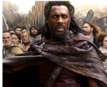
2017 THOR, RAGNAROK (Thor: Ragnarok) de Taika Waititi