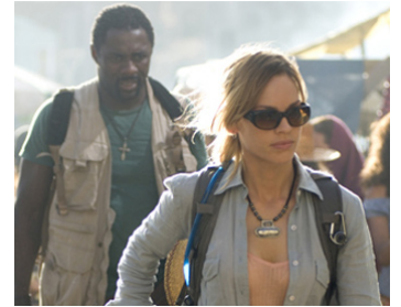
2007 LES CHÂTIMENTS (The Reaping) de Stephen Hopkins avec Hilary Swank