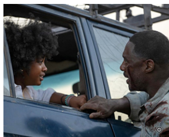
2022 BEAST (Beast) de Baltasar Kormakur avec Leah Jeffries