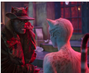
2019 CATS (Cats) de Tom Hooper avec Francesca Hayward