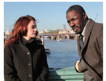
2011 LUTHER (Luther) de Neil Cross avec Ruth Wilson