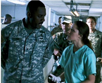
2007 28 SEMAINES PLUS TARD (28 Weeks Later) de Juan Carlos Fresnadillo avec Rose Byrne