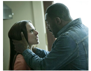
2014 DOUBLE TRAHISON (No Good Deed) de Sam Miller avec Kate del Castillo