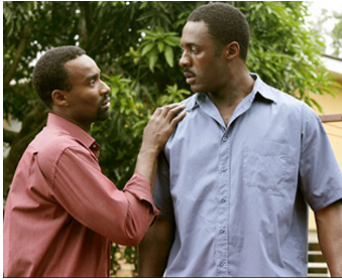
2005 QUELQUES JOURS EN AVRIL (Sometimes in April) de Raoul Peck avec Oris Erhuero