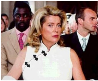
1999 BELLE-MAMAN de Gabriel Aghion avec Catherine Deneuve